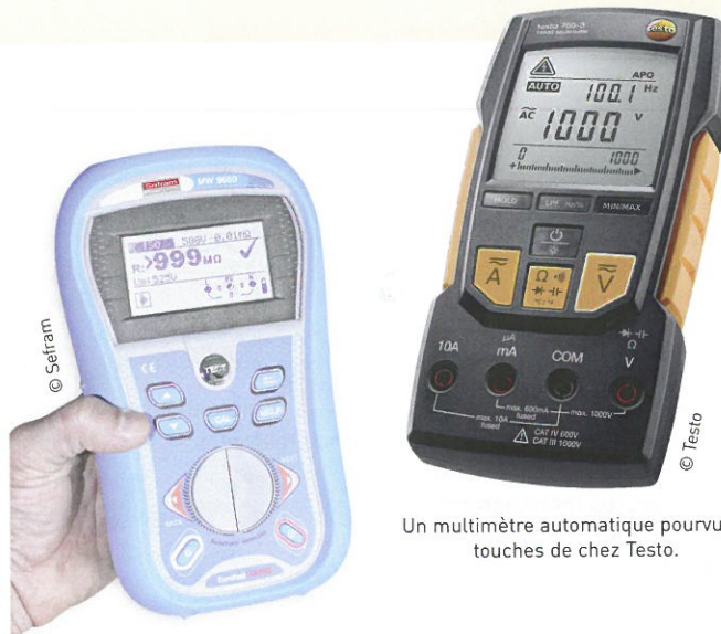
Le contrôleur d'installations électrique MW9660 proposé par Sefram.

En matière de thermographie infrarouge, la tendance est à la généralisation d'un usage aujourd'hui à la portée de tous les professionnels du bâtiment. En tant que spécialiste, Flir propose à présent Flir