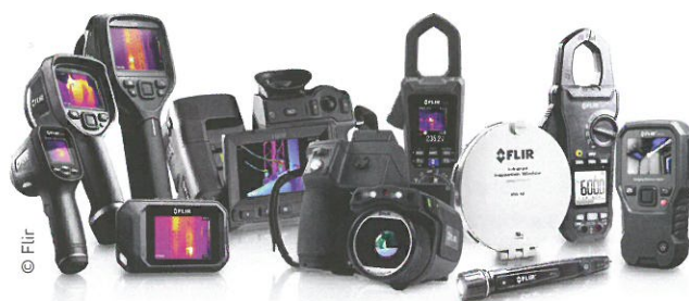
La gamme Test et Mesure de Flir, dont la pince ampèremétrique avec caméra de thermographie intégrée.

Avec ses pointes de touches IP2X 4 mm et 2 mm, l'utilisateur est en sécurité en toutes circonstances. Appareil de terrain, il ne craint pas les chocs et permet un éclairage de la zone de mesure pour les mesures lorsque cela est nécessaire.