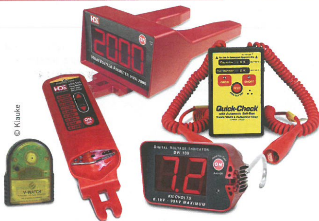
L'offre de mesure de courant sur ligne de transport et de distribution HD Electric, importée en France par Klauke.

relative. Et pour les mesures de courants élevés ? Interviennent les accessoires Flex SP295 et SP296 permettant d'étendre les possibilités de mesure des multimètres jusqu'à 3 000 A AC.