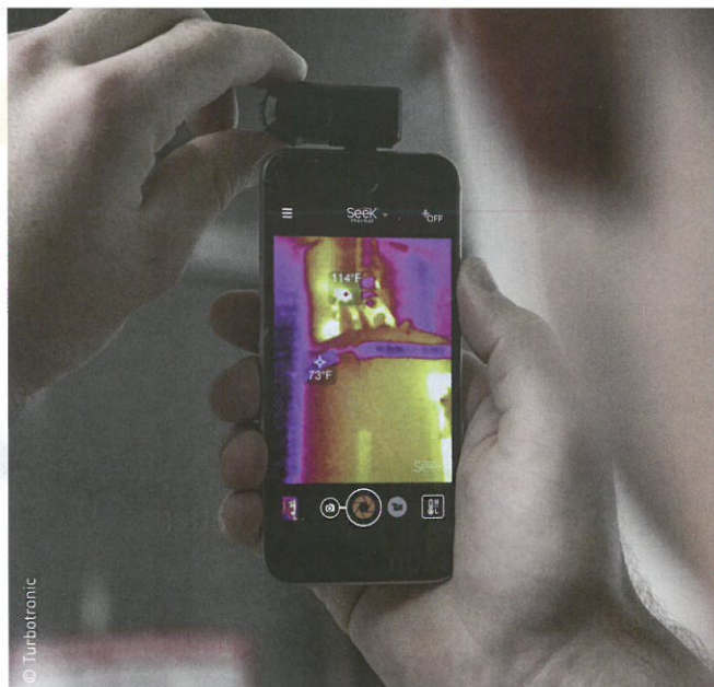
Chez Turbotronic, un accessoire permet de transformer son smartphone en caméra de thermographie infrarouge.

Exemple avec l'ampèremètre numérique haute tension HVA-2000. Disposé en bout d'une perche isolée, cet appareil léger (820 g) mesure le courant alternatif jusqu'à 2 000 A, et sur des tensions en réseau jusqu'à 500 kV, d'une fréquence de 25 à 500 Hz. Le tout avec une précision de 1 %. Son grand écran lumineux permet de visualiser la