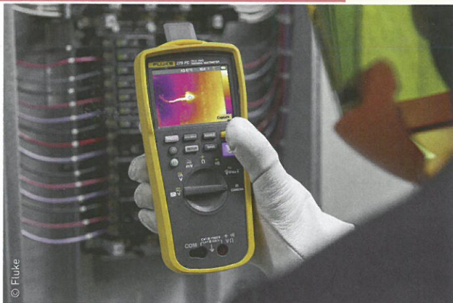
Le multimètre Fluke 279 FC embarque une caméra de thermographie infrarouge.